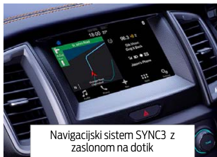
Navigacijski sistem SYNC3 z zaslonom na dotik