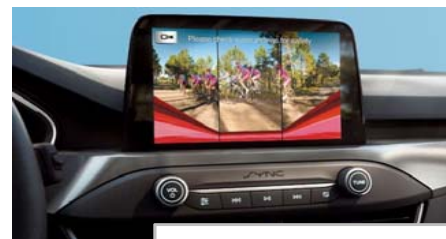
Kamera za pomoč pri vzvratni vožnji