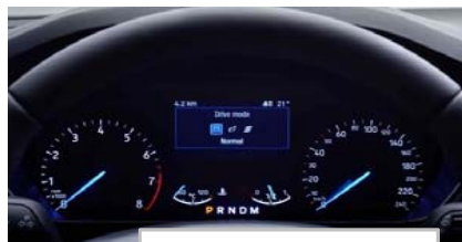
Izbira voznega načina