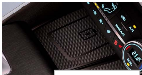
Brezžično polnjenje telefona