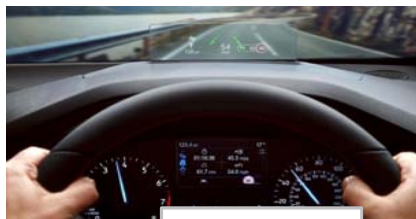
Heads up display