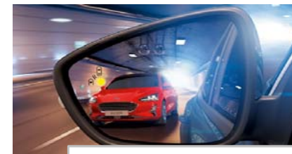
Sistem za zaznavanje mrtvega kota