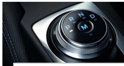
Samodejni 8-stopenjski menjalnik