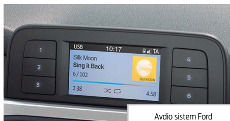
Avdio sistem Ford