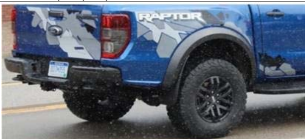
Slika levo zgoraj: Stilska Raptor polepitev Slika desno: brez polepitve