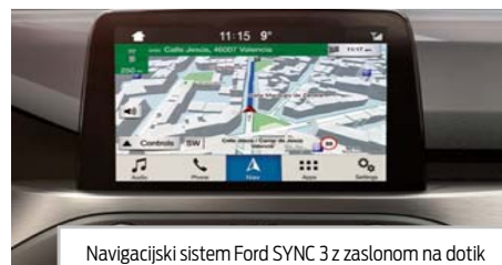
Navigacijski sistem Ford SYNC 3 z zaslonom na dotik